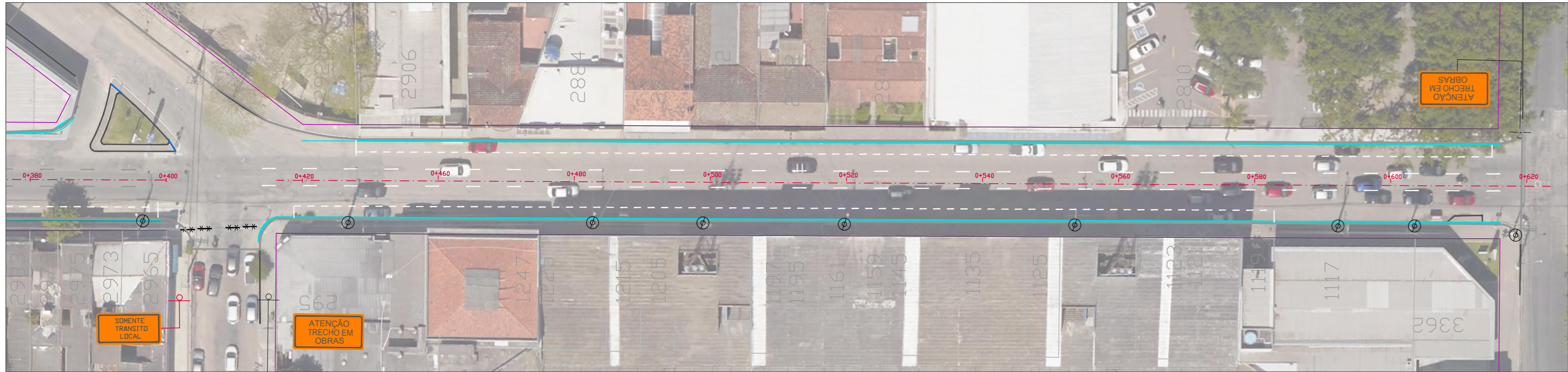
PLANTA BAIXA - TRECHO 2 ESC. 1:500