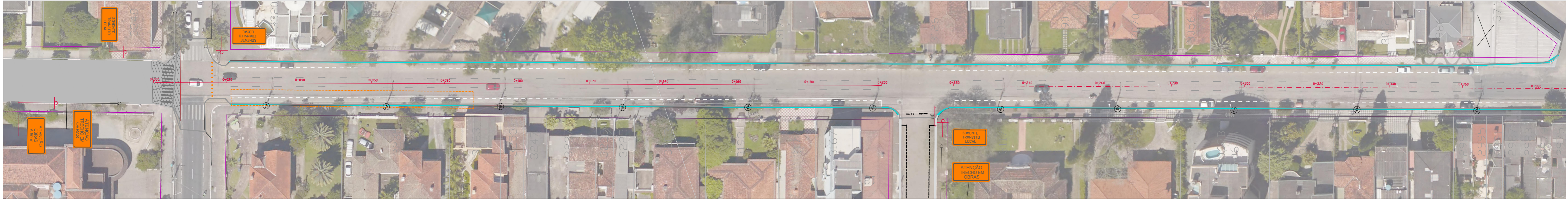
PLANTA BAIXA - TRECHO 1 ESC. 1:500